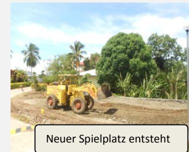
Neuer Spielplatz entsteht

bestimmt. Es bleibt noch genügend Platz für ein Spielhaus. Ich werde wegen der Termiten als Baumaterial anstatt Holz, Stahlrohre verwenden müssen.