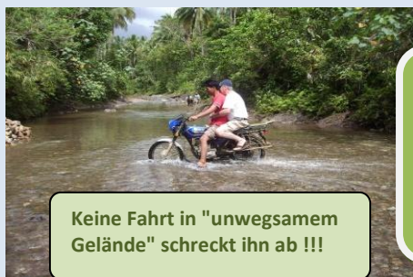
Keine Fahrt in "unwegsamen Gelände" schreckt ihn ab !!!

Jede neue Herausforderung wirkt bei ihm wie ein Gesundbrunnen