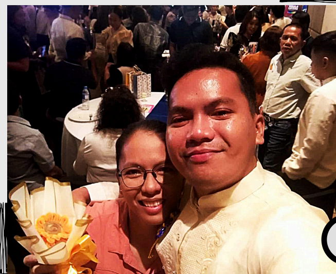
Die stolze Mama!