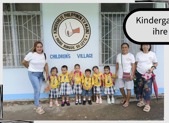
Kindergarten-Kinder und ihre Hausmütter