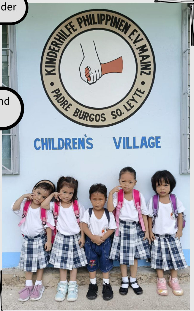
Zuckersüß, unsere Kindergarten-Kinder

Das 3. Quartal beginnt - wie fast überall auf der Welt - mit dem neuen Schuljahr, bzw. Semester. Dank der Spenden auf unseren Aufruf vom August, waren unsere Schüler*innen und Studierenden bestens ausgerüstet. An dieser Stelle herzlichen Dank!