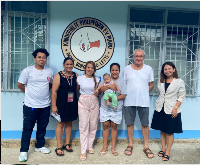
Verwöhnt von den Mitarbeiterinnen im Büro