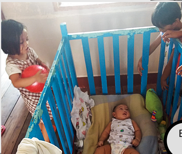
Bestaunt von den neuen "Geschwistern"